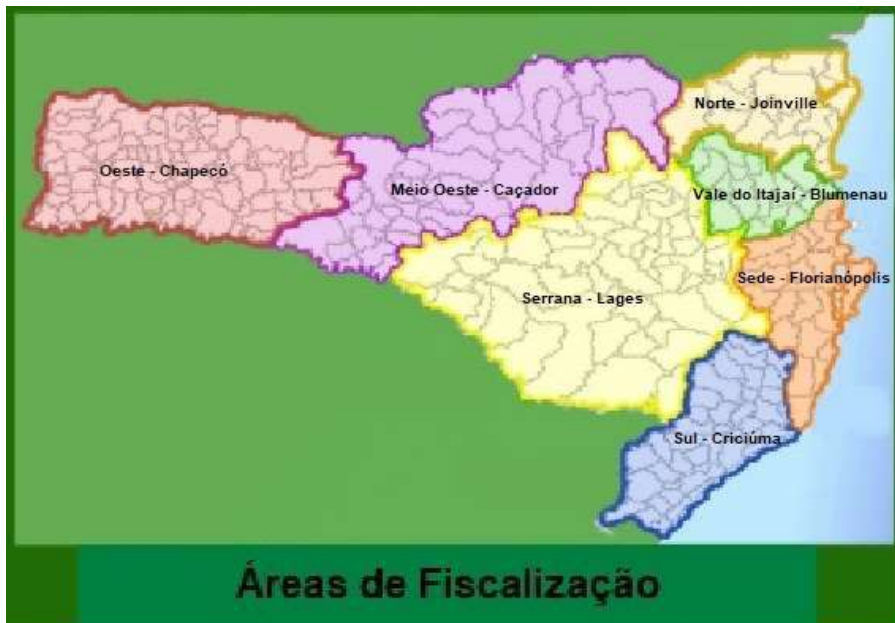
Figura 1 - Mapa do Estado de Santa Catarina ilustrando as regiões de Fiscalização e suas respectivas Cidades-Sede.